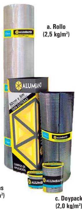
a. Rollo (2,5 kg/m 2 )